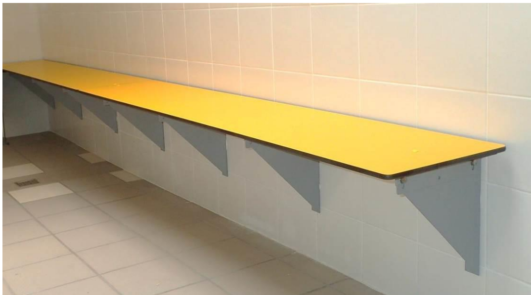
Assise de banc BELEM sur consoles murales en acier laqué (uniquement sur murs en béton ou parpaing de béton)

Bancs avec assise droite "BELEM" en 2 épaisseurs de compact 10 +10 mm (13 + 13 mm)