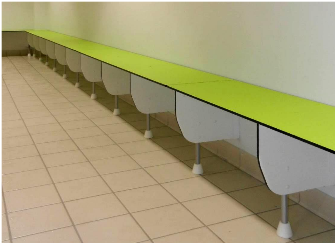
Assise de banc BELEM sur consoles mur / sol avec pieds réglables Fixation sur cloison légère en brique ou plaque de plâtre